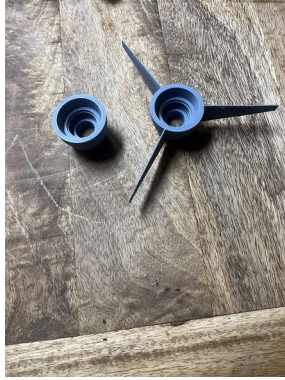
Embase (a ailettes ou non)