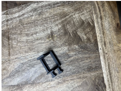
Mécanisme de déclenchement