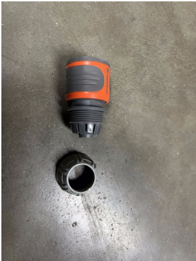
Raccord d'arrosage rapide Gardena