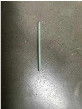
Axe diamètre 2.5mm