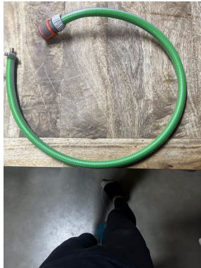
Tuyaux arrosage avec valve vélo