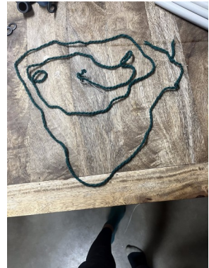
Goupille avec ficelle