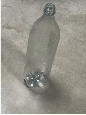
Bouteille de Schweppes