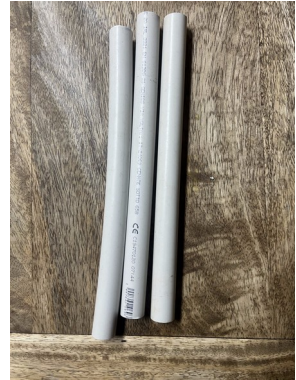
Tube PVC diamètre 20mm (x3)