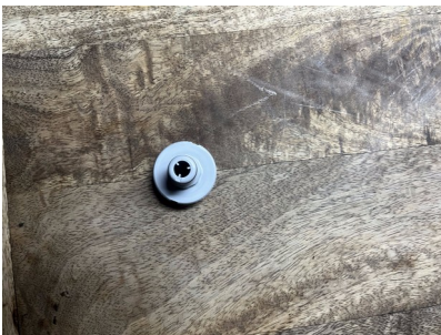
Nez de robinet Gardena diamètre 33mm